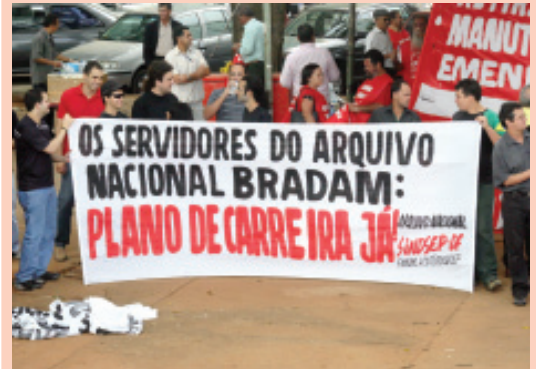
■ Mobilizados, servidores param por 24 horas

contra o PLP 01 e pela manutenção do veto à Emenda 3. A principal reivindicação específica da categoria é o plano de carreira e a concessão da GSISTE aos recém-concursados. Por esta razão, eles mantêm a mobilização no órgão.