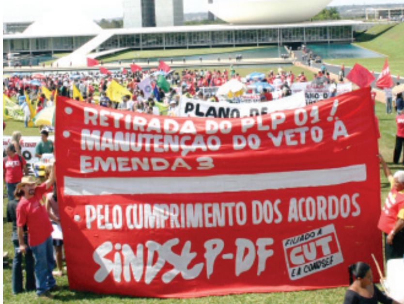
■ Faixa que abriu a coluna do Sindsep-DF no ato do dia 23 de maio

Milhares de trabalhadores do setor público e privado saíram às ruas, em todo o Brasil, no dia 23 de maio exigindo a retirada do PLP 01 (congelamento