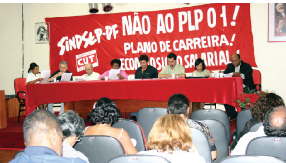
■ Conselho Fiscal apresenta o parecer das contas do exercício 2006 em assembléia no Sindsep