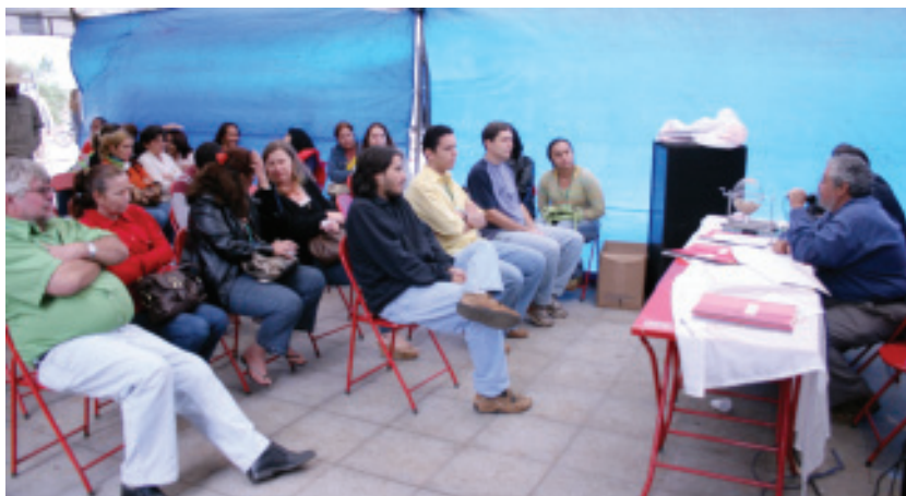
■ Palestra, jogos e atividades diversas mantêm a mobilização no Incra

Em Brasília, o comando local de greve tem promovido diversas atividades na sede do órgão, como jogos, palestras, encontro com entidades parceiras. Grupos trabalham na articulação com os parlamentares para abrir um canal de negociação com o governo. Nesta semana, chegam os representantes das superintendências regionais e será instalado o Comando Nacional de Greve.