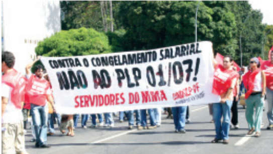
■ MMA participa de ato na Esplanada dos Ministérios

Os servidores do MMA decidiram, por unanimidade, em uma assembleia bastante concorrida, no dia 23.05, fazer uma paralisação de 48 horas, entre 30 e 31 de maio, para exigir a abertura de negociação da sua pauta de reivindicações.