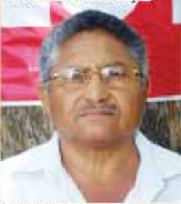
Pedro de Alcântara