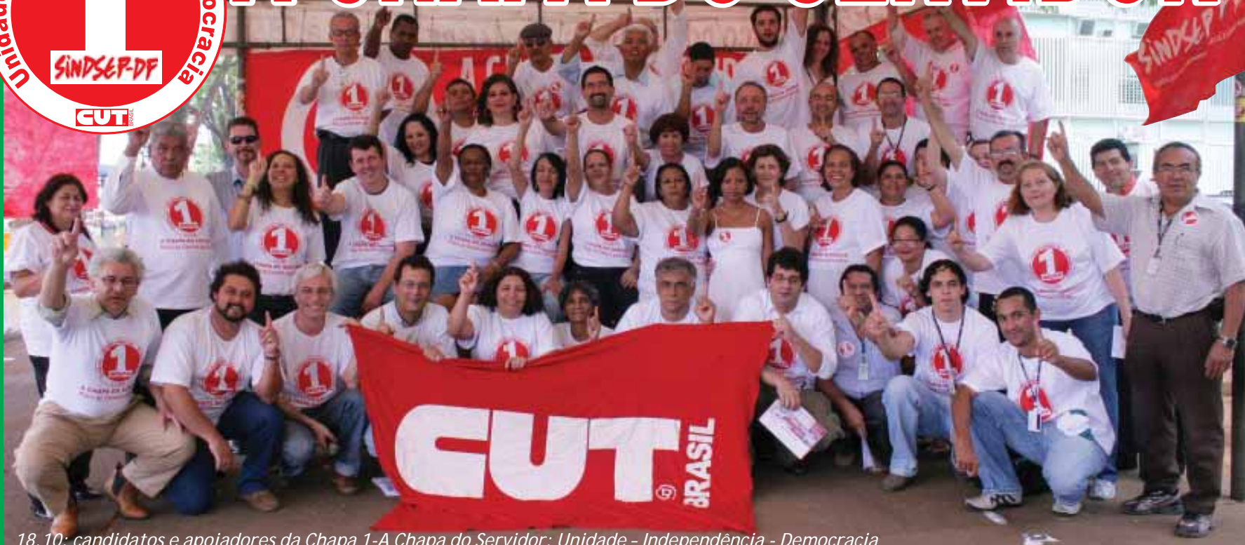
18.10: candidatos e apoiadores da Chapa 1-A Chapa do Servidor: Unidade - Independência - Democracia

Estes são os Coordenadores da Chapa 1: você já conhece da luta!