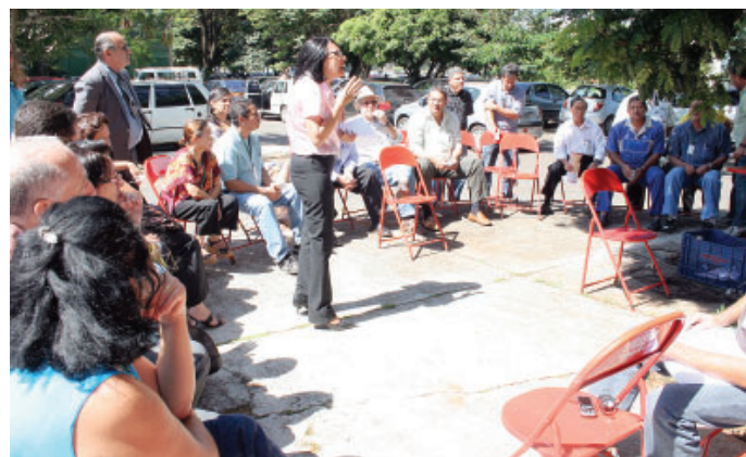
■ 12.05: assembleia dos servidores do MPlanejamento aprova realização de atos todas as quartas-feiras

limitação no número de gratificações, agora o ministério resolveu realizar um processo seletivo para a ocupação de cargos que recebem a GSISTE. A questão é que a seleção é aberta para todos os servidores do Executivo, exceto para os que estão lotados no Ministério do Planejamento. A decisão deixou a categoria indignada e aumentou a disposição