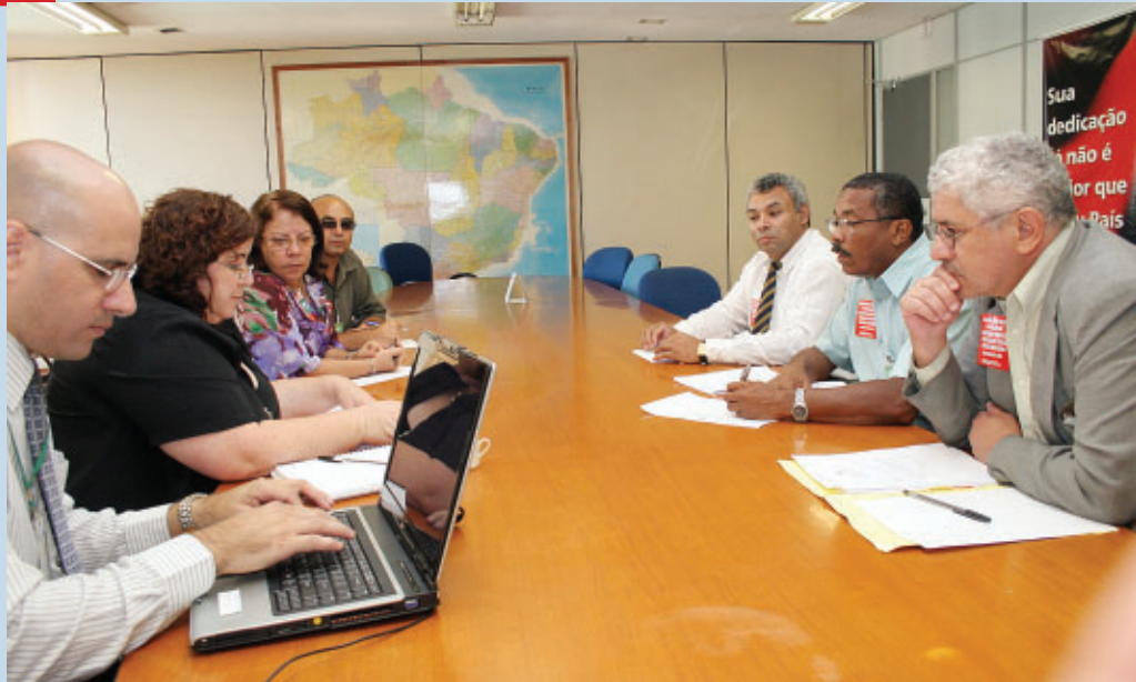
■ 14.05: em reunião com representantes dos servidores do MRE, a SRH promete definir agenda de negociações para os próximos 70 dias