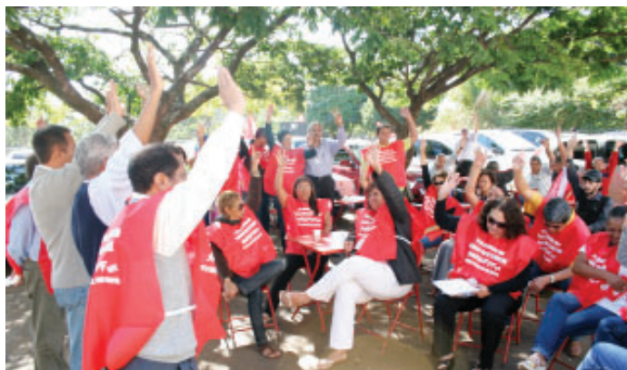
■ 23.06: durante paralisação, os servidores do DNPM aprovam em assembleia realização de novo ato nesta terça-feira, dia 30.06

desta vez em frente ao Ministério do Planejamento (bloco C), a partir das 10h, nesta terça-feira, dia 30.06. O Sindsep-DF disponibilizará um ônibus com saída às 9h do estacionamento do DNPM. Na ocasião, serão entregues ao secretário Duvanier os abaixo-assinados pela retificação da tabela colhidos nacionalmente.