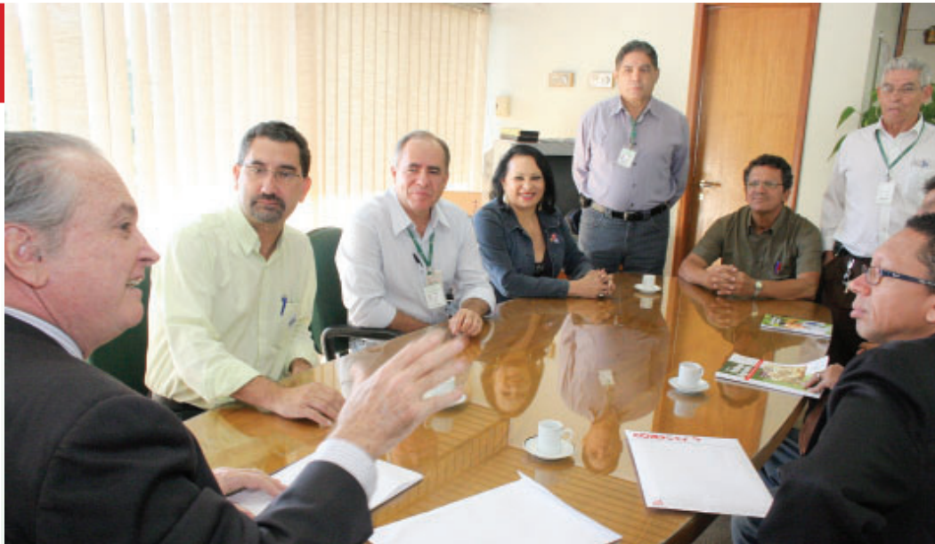
■ 24.06: direção recebe reivindicações para Acordo Coletivo de Trabalho