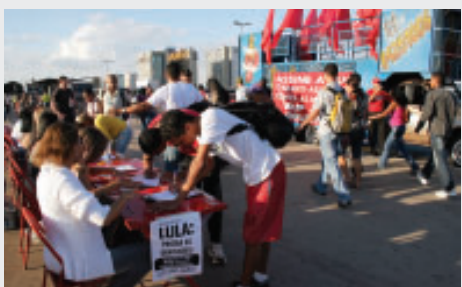
26.06: na Rodoviária do Plano Piloto, trabalhadores assinam abaixo-assinado pela edição de uma MP que proíba as demissões em função da crise

Na tarde do dia 26.06, na plataforma superior da Rodoviária do Plano Piloto, uma atividade conjunta do Sindsep-DF, CUT e Movimento dos Sem-Teto, coletou mais de mil assinaturas a favor da edição emergencial de uma Medida Provisória que proíba as demissões. A campanha integra a luta para que os trabalhadores não paguem pela crise. No dia 26 de agosto, as entidades irão entregar o abaixo-assinado ao presidente Lula. Participe você também! Acesse o abaixo-assinado no endereço www.sindsep-df.com.br .