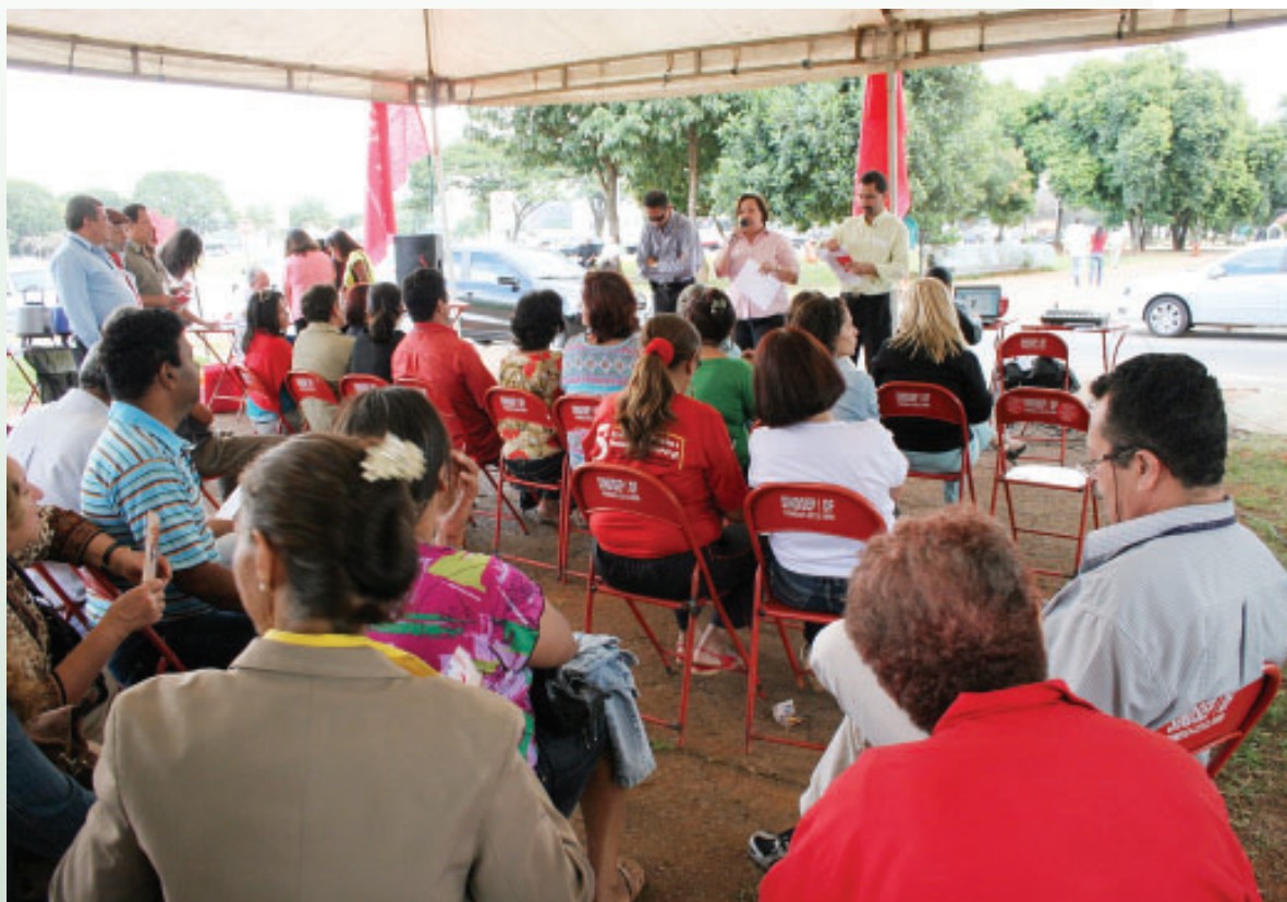
■ 24.06: servidores do Ministério da Fazenda elegem delegados ao Encontro Fazendário, que acontece dia 10.07

necessidade de mobilização constante e conclamou todos a participarem do Encontro Fazendário no dia 10.07, na sede da Condsef, para acompanhar o debate nacional sobre a aglutinação dos cargos e tabela salarial para 2010. "Só é lembrado pelo governo quem fica de pé na sua janela e grita!", completou animando a categoria. Portanto, fazendários, fiquem atentos às novidades e sob permanente mobilização. O próximo Dia Nacional de Luta será em 15 de julho, com manifestações em todos os estados. Essa é a data que o governo está colocando como limite para as negociações salariais. A hora para mobilizações é agora.