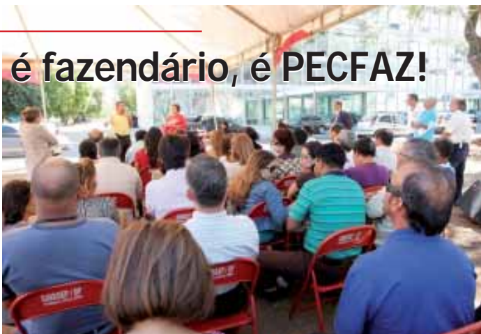
13.08: assembleia dos servidores da Fazenda aprova realização de ato nesta quarta-feira, dia 26

Com muita disposição de luta, a base fazendária no DF se mobilizará nesta quarta-feira, dia 26.08, a partir das 8h, em frente ao Ed. Órgãos Regionais (na portaria da Receita Federal do Brasil), em defesa da valorização do Plano Especial de Cargos da Fazenda (PECFAZ), que incluiu todos os servidores da Fazenda, porém o quadro se encontra fechado e não absorveu sequer os novos concursados que também começam a exigir fazer parte do mes-