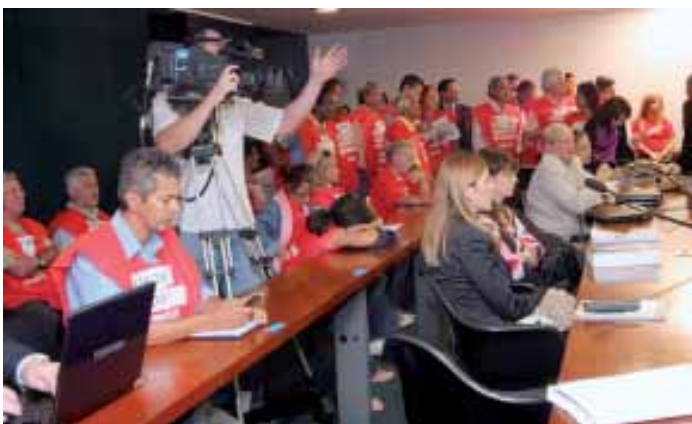
12.08: servidores demitidos no governo Collor assistem à votação que aprovou o PL 5.030, que reabre o prazo para anistia, na Comissão de Trabalho da Câmara dos Deputados.

A Comissão Especial Interministerial (CEI) do Ministério do Planejamento, responsável pela reintegração dos servidores demitidos durante o governo Collor, realiza nesta sexta-feira, dia 28.08, a IV Reunião Extraordinária de Prestação de Contas. A participação dos anistiados é muito importante. A reunião será no auditório do MPlanejamento (bloco K), das 9h às 12h. Os interessados devem se inscrever pelo e-mail cei@planejamento.gov.br , informando nome, CPF e empresa que trabalhava.