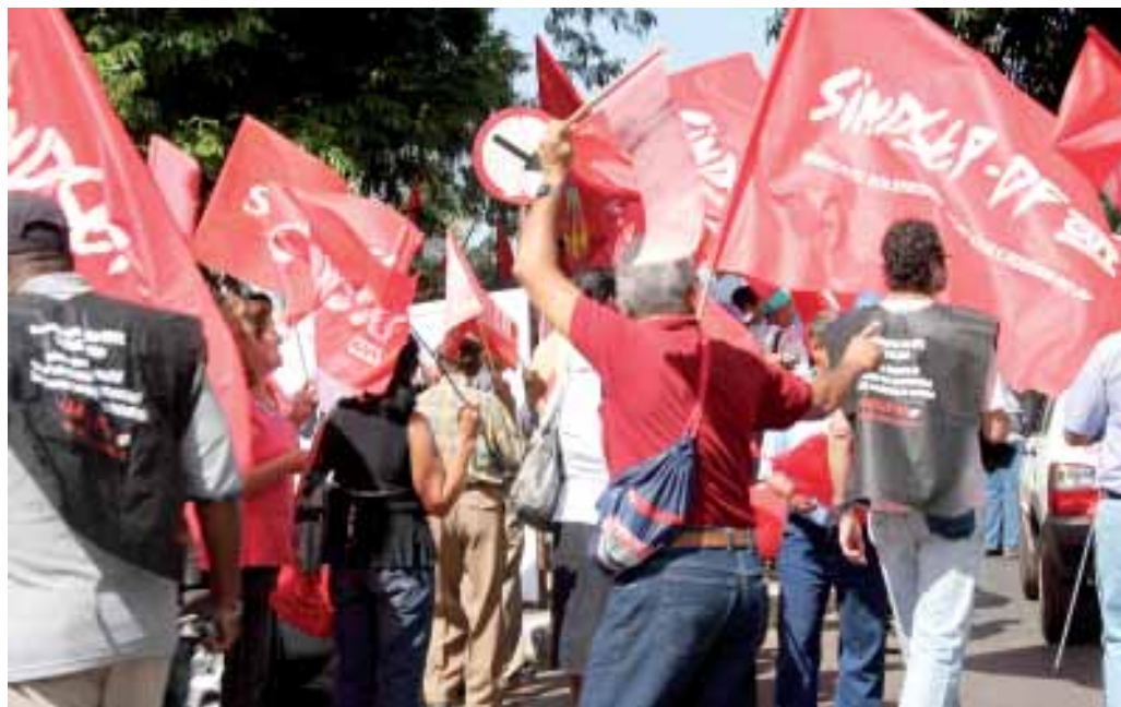
19.08: cerca de 1,5 mil servidores do Executivo realizam ato em frente ao Ministério do Planejamento

Participe! É a unidade da categoria que garante a vitória!