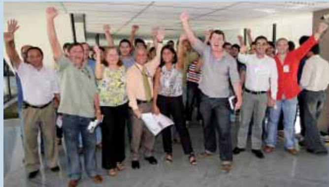
13.08: em assembleia, servidores do MTE se preparam para participar de ato nacional nesta terça, 25

plantação do GT para a discussão da carreira. A proposta do plano já foi encaminhada pelo ministro Carlos Luppi para o ministro Paulo Bernardo, em 19.02. Além do VB e da Gratificação de Desempenho, a estrutura remuneratória também será composta por Gratificação de Qualificação (GQ) para os servidores de nível superior, intermediário e auxiliar que possuem títulos, diplomas ou certificados de conclusão de cursos de ensino médio, graduação ou pós-graduação desde que não sejam exigidos para o provimento do cargo ocupado pelos servidores.