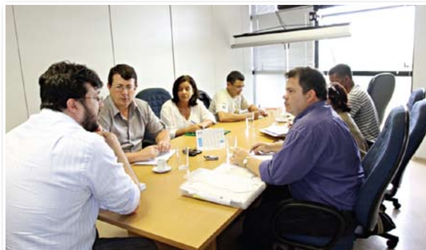
23.11: senador Gim Argello (PTB/DF), relator do Orçamento 2011, com a direção do Sindsep-DF e comissão de servidores