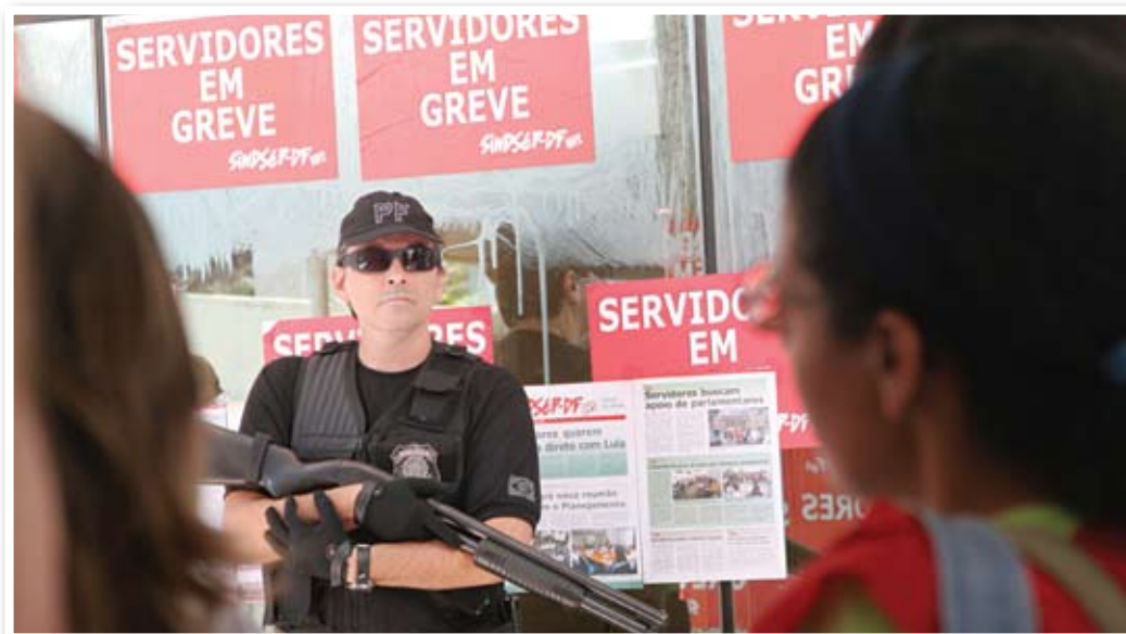
27.05.10: polícia federal fortemente armada tenta coibir concentração de greve dos servidores do INEP

os servidores não fossem punidos por exercer o seu direito de greve garantido pela Constituição brasileira, o sindicato organizou um ato histórico em frente ao Superior Tribunal de Justiça (STJ) que contou com a participação de diversos setores que estavam em greve e levou aquela Casa a declarar legal a greve do