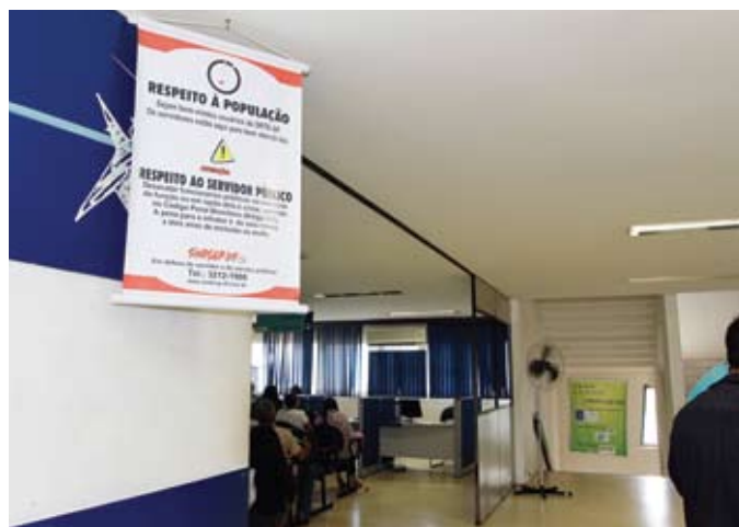
Banner do Sindsep-DF afixado no interior da SRTE (509 Norte)