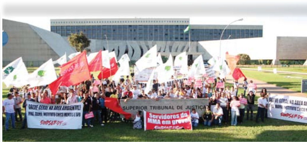
03.05.10: ato histórico em frente ao Superior Tribunal de Justiça (STJ) marcou a luta em defesa do direito de greve e contra o corte do ponto

Foram diversas batalhas empreendidas pelo Sindsep-DF em defesa do direito de greve e contra o corte do ponto ao longo de 2010. Entre as ações para que