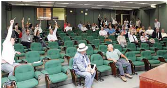
28/06: assembleia esvaziada forja criação de sindicato de gaveta na Conab