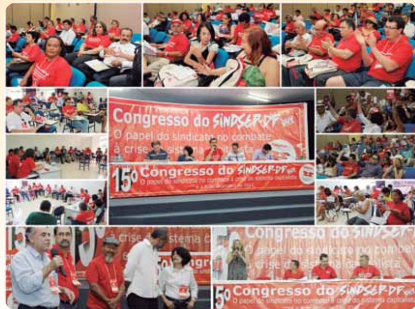
15º Congresso do Sindsef-DF reuniu mais de cem delegados no CNIT de Luziânia. Na foto, registros dos três dias de atividades.

O primeiro dia do Congresso concentrou as discussões no tema do evento “O papel do sindicato no combate à crise do sistema capitalista”. Todos os convidados fizeram questão de ressaltar a importante atuação do Sindsef-DF na organização dos servidores do DF na Campanha Salarial 2012, que sustentou uma greve vitoriosa de 72 dias, principalmente no que