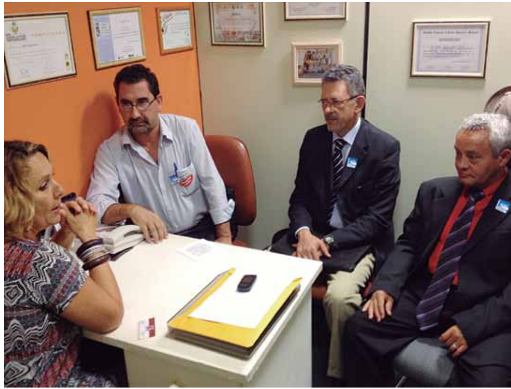
14/12: reunião da direção do Sindsep-DF com a deputada federal Érika Kokay